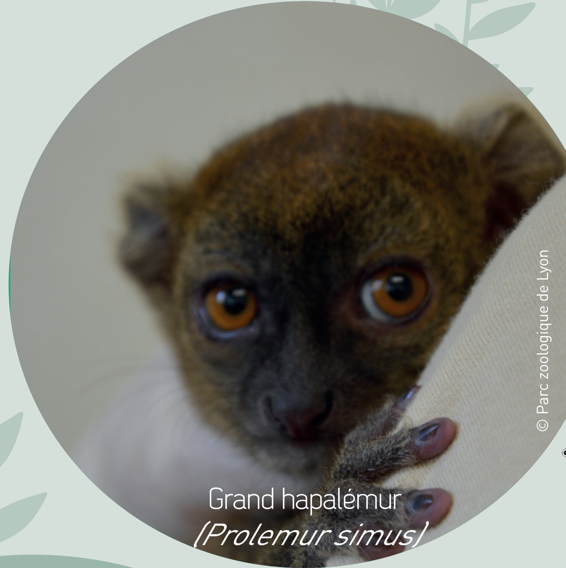
Grand hapalémur ( Prolemur simus )

Ils réalisent également des séances de training avec les animaux.